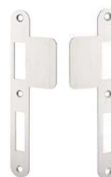
02 E-122L EN E-122R