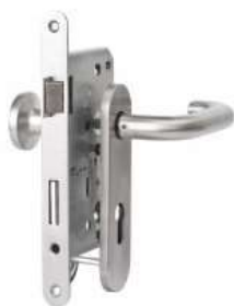
01 E-NDE 1L OF E-NDE 1R